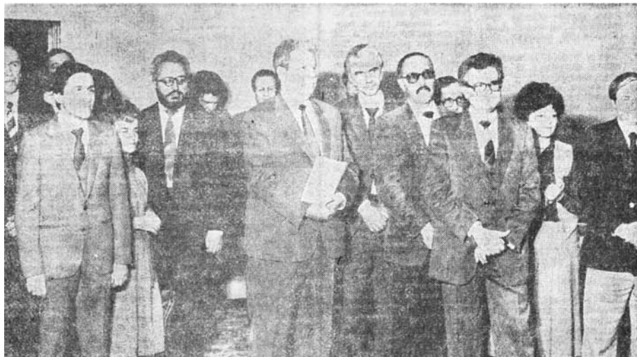
Част от наградените участници в националния конкурс-съревнование „Изследване – внедряване – световно равнище”

На основата на опита в Химко – Враца, творчески колектив от научни работници и специалисти ръководен от ст.н.с. к.ик.н. Ганчо Попов разработи и внедри в Завод „В. Пик“ - Бели Извор, Врачанско Единна система за управление на ръководните кадри и специалистите, под формата на писана управленческа технология за работа с кадрите.