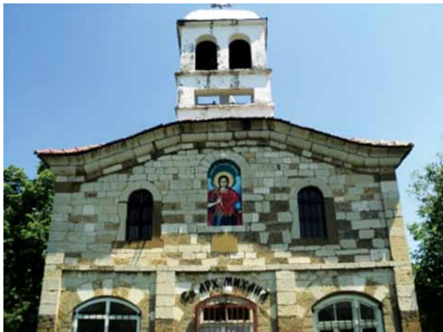
Църквата в с. Крушуна сега

Ще се опитам да Ви представя църквата със снимки.